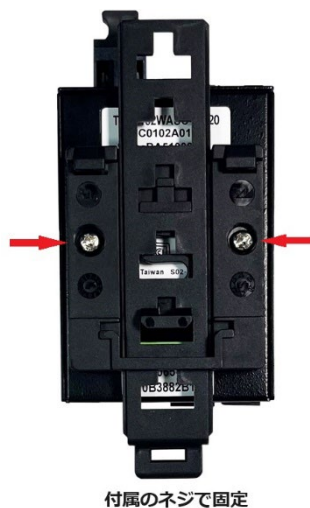
【TMC シリーズ取付穴寸法】