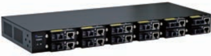
TMC-CHASSIS-12-1A (AC電源1台搭載) TMC-CHASSIS-12-2A (AC電源2台搭載)