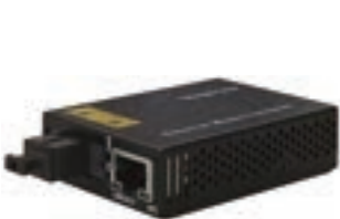
通常のTMCシリーズのサイズ